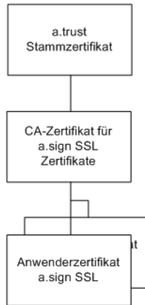
Abbildung 2: Zertifizierungshierarchie